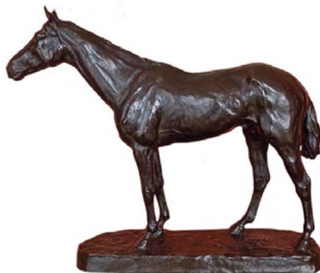
Het bronzen paard waar mijn vader erg op was gesteld.

'Met vrachtwagens werden we naar kamp Tangerang gebracht, gehuisvest in de oude jeugdgevangenis Tanahtinggi, gelegen ten westen van Batavia. Aan kamp Tangerang heb ik weinig herinneringen. In dit kamp werden wij ondergebracht in de barakken waarin koelies voor de Deli tabaksplantages hadden gewoond. Joodse en Joods-Irakese vrouwen en kinderen werden in aparte barakken gehuisvest. Wij sliepen in een barak met alleen maar Nederlandse vrouwen en kinderen.