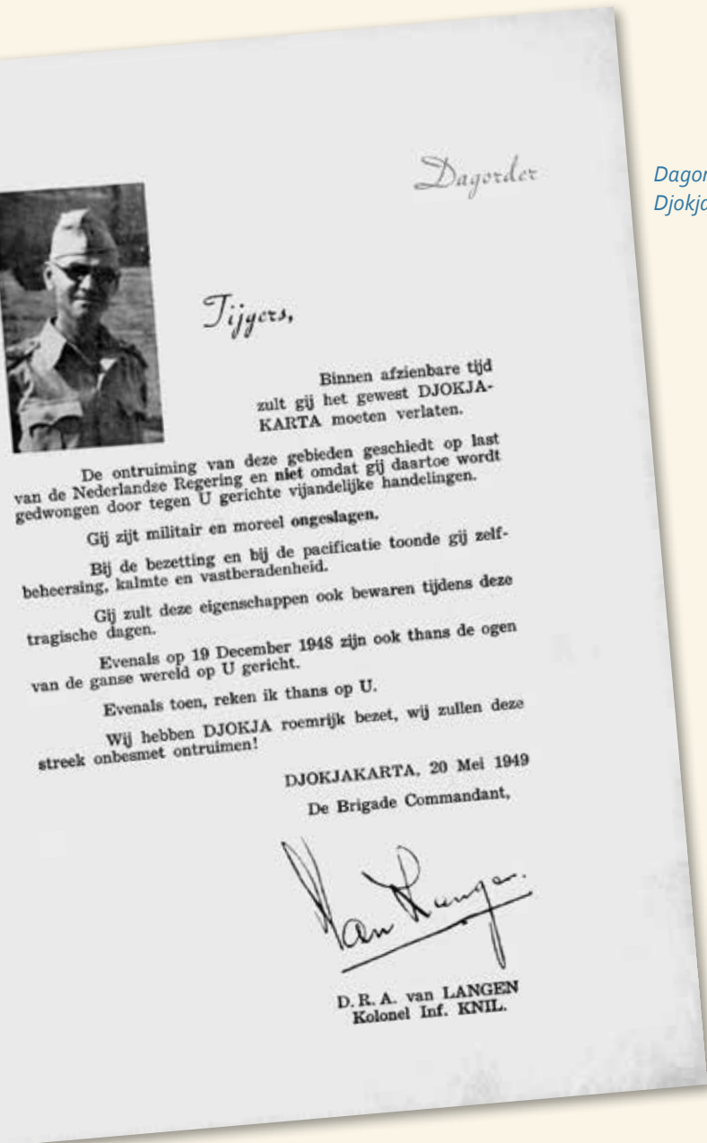
Dagorder van Van Langen bij de overdracht van Djokjakarta aan Soekarno, 20 mei 1949.

Over zichzelf bleef opa kort. Hij was ‘KNIL’ geweest. Voor de oorlog en erna – de oorlog zelf sloeg hij maar over. Toen Indië een ‘rotzooi’ werd had hij als commandant Djokja veroverd en Soekarno gevangen genomen. Wat dus niks geholpen had. Waaraan mijn moeder achteraf dan toevoegde dat hij nog generaal-majoor geworden was en chefstaf van de Nederlandse troepen. Jemig, generaal, ik glom van trots.